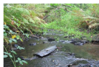
Exemple de bon état hydromorphologique