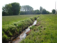
Exemple d'Etat hydromorphologique Fortement altéré

Pour vous permettre de répondre à toutes les questions que vous vous posez sur la question de la GEMAPI, la commune vous propose une rencontre avec le technicien Guillaume CHAPIN, en charge de cette question au sein de la CCLB, le samedi 30 octobre de 10h à 12h à la salle des Fêtes.